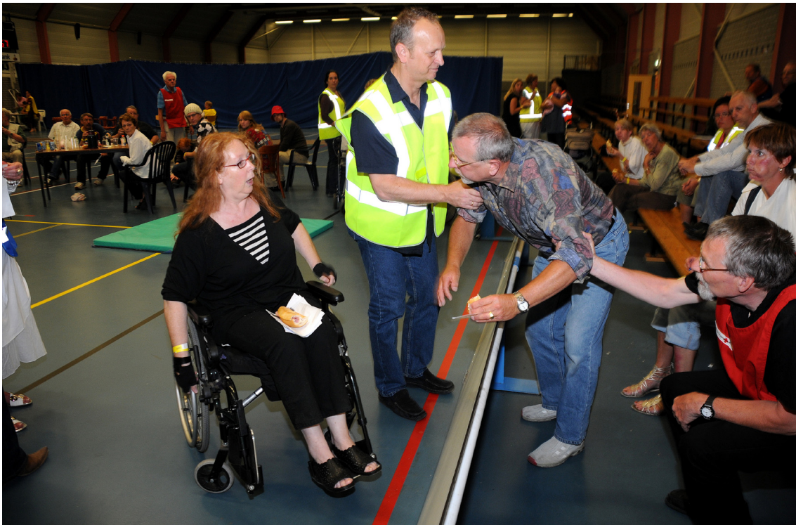
(rampenoefening van de gemeente Dordrecht)