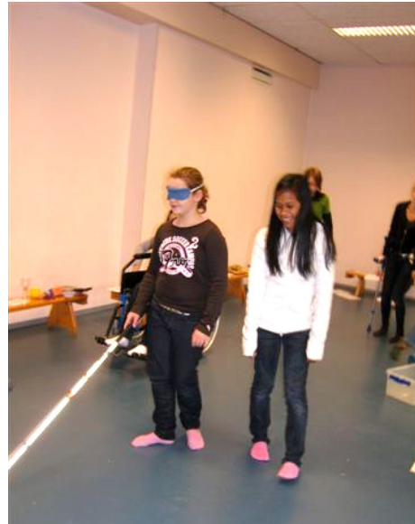
(Leerling in actie met een taststok)

Op verzoek van de gemeente wordt een werkgroep Migranten Senioren Dordrecht (MSD) samengesteld, die advies zal geven over de afstemming van vraag en aanbod van wonen, zorg en welzijn voor migranten senioren. De gemeente heeft hiervoor speciale subsidie toegekend. Het streven is de werkgroep in januari 2009 te starten. Het is een tijdelijke werkgroep. Jaarlijks zal de voortgang van de werkgroep worden geëvalueerd en vervolgens wordt bekeken of de werkgroep zal worden voortgezet. Voor de ondersteuning van de werkgroep is een parttime beleidsmedewerker aangetrokken.